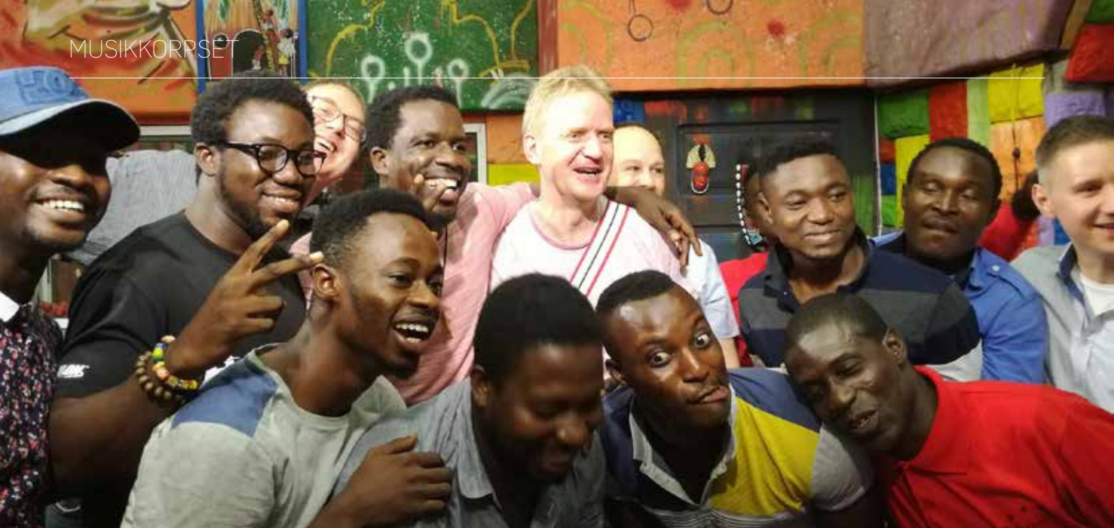
Fra slutningen af en prøve med de ghanesiske kolleger.