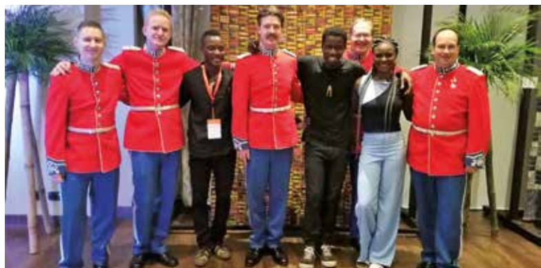
Livgardens Messingkvintet ved H.M. Dronningens returmiddag for Ghanas præsident.

Livgardens Messingensemble har endnu engang være på statsbesøg i udlandet med H.M. Dronningen. Som tak for gæstfrihed afholdt H.M. Dronningen en returmiddag for Ghanas præsident H.E. Nana Addo Dankwa Akufo-Addo, hvor der var lejlighed til at høre dansk taffelmusik og til at se frugten af det hurtigt etablerede samarbejde mellem vores kolleger fra Musikkorpset og musikere fra Ghana. At spille sammen med de afrikanske musikere var en spændende, kulturel indsprøjtning, og der var gensidig respekt for hinandens kunnen – også selvom der blev grinet meget og prøverne endte som ren musikfest. Fire intense dage i Ghana med officiel musiceren og et indblik i en anden musikverden.