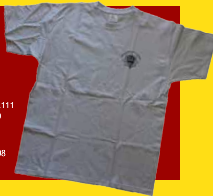
LG T-SHIRT HVID, ITM: LG 1001 KR. 100,00 SORT, ITM: LG 1002 KR. 100,00 ARMY, ITM: LG 1003 KR. 100,00 Str. M - L - XL - XXL