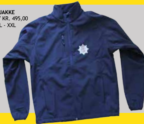
SOFTSHELL JAKKE ITM: DG 5007 KR. 495,00 Str. M - L - XL - XXL