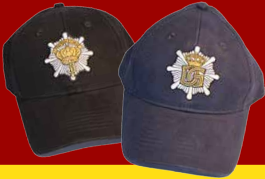
LG CAP ITM: LG 2111 KR. 95,00

BESØG VORES NYE WEBSHOP PÅ WWW.GARDERSHOP.DK