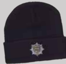
LG STRIKHUE ITM: LG 2101 KR. 90,00