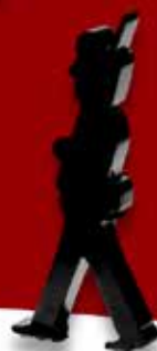
VAGTGÅENDE GARDER ITM: DG 2202, KR. 549,00