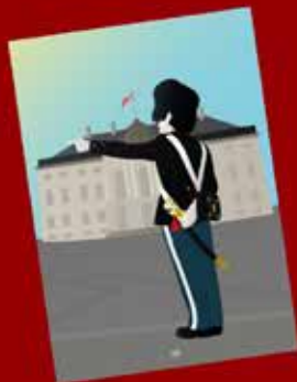
GARDERPLAKAT (50X70) ITM: DG 9500 KR. 195,00