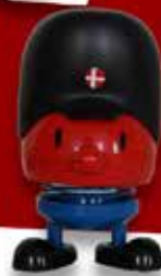
GARDER-HOPTIMIST ITM: 002203, KR. 195,00