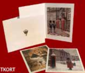
DOBBELTKORT M. GARDERMOTIV 5 STK. KR. 50,00

Mail: dgglavind@dbmail.dk Tlf.: 3054 3891/5854 8591