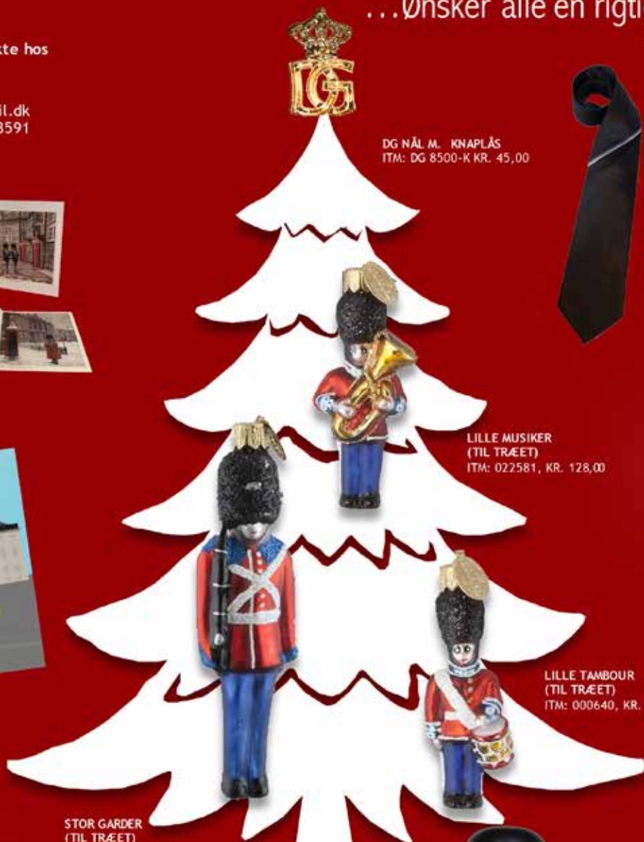
LILLE MUSIKER (TIL TRÆET) ITM: 022581, KR. 128,00