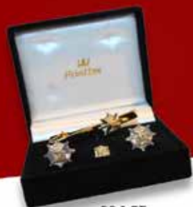
DG SÆT ITM: DG 8512, KR. 350,00