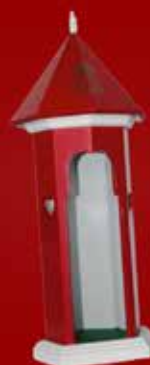
FLASKESKJULER ITM: DG 9100, KR. 295,00