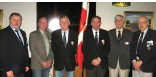
Formanden med modtagerne af 25, 40 og 50 årstegn.

har foreningen afholdt den årlige generalforsamling på Ryes Kaserne med 30 deltagere, udlevering af årstegn, indtagelse af Danmarks Nationalret og efterfølgende kammeratligt samvær.