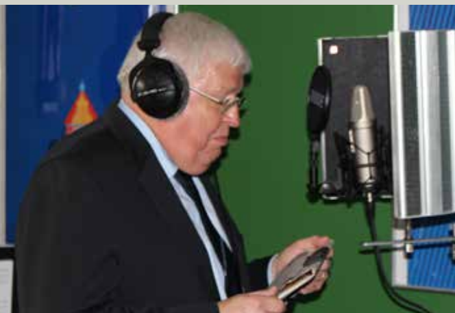
Præsident Flemming Rytter leverer indtaling ved fremvisning de nye programmets funktioner.