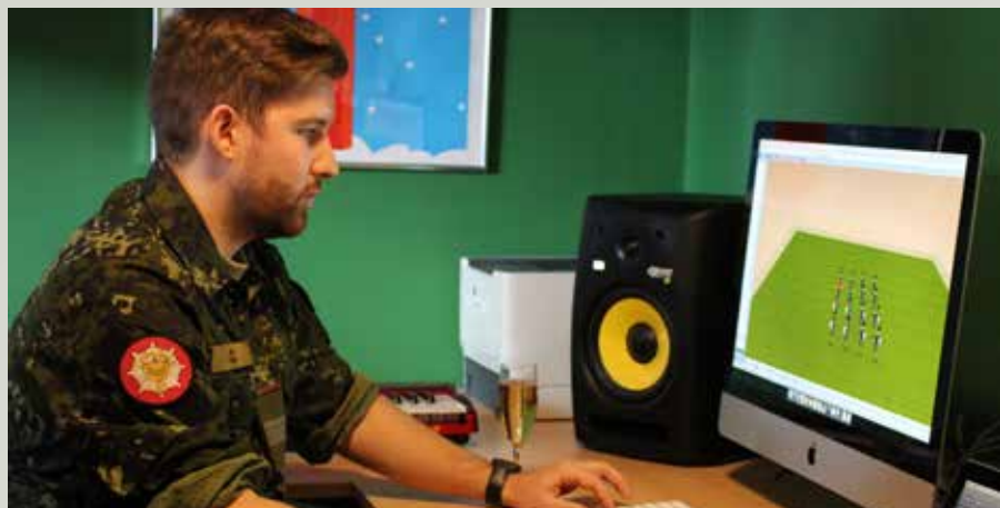
OKS1, C. C. Fremviser funktionerne i de nye programmer .

Mandag d. 25. Afholdtes en lille reception for at markere indvielsen af Tambourkorpsets nye studie.